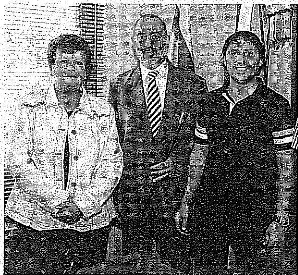
Pleno de investidura en el Ayuntamiento de Rellinars.

¿Cuál es la motivación final de esta iniciativa? Desde la oposición han querido recordar que "las recién aprobadas ordenanzas fiscales nos han dejado un incremento en el área de basuras, o mejor dicho, se dejarán de dar las bonificaciones que aporta el Ayuntamiento y que ascienden a unos 11 mil euros". Según los cálculos de la coalición, si el equipo de gobierno accediese a suprimir las aportaciones a los miembros del ejecutivo, "el ahorro