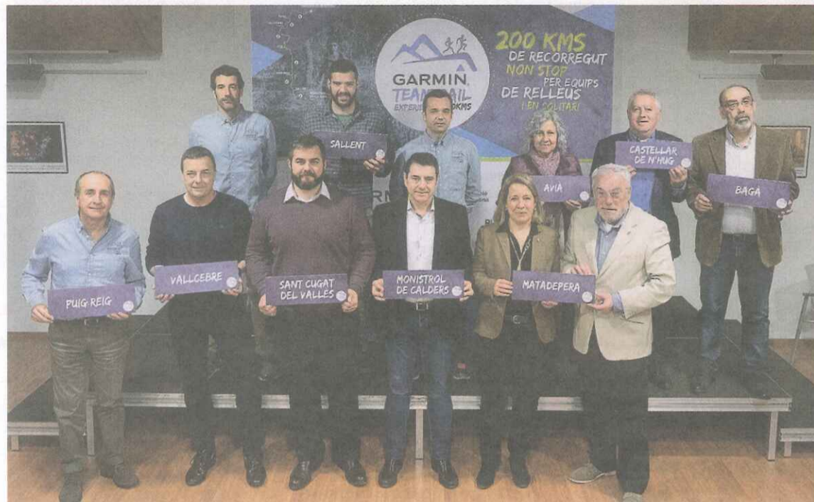
Varios alcaldes y concejales de las nueve poblaciones, en el Casal de Cultura de Matadepera. MIQUEL BADIA

En nueve de ellas se han establecido controles de paso. La aventura comenzará el sábado 17 de junio a las diez de la mañana en las fuentes del Llobregat, en Castellar de n'Hug, y finalizará el domingo 18 por la mañana en Sant Cugat. Las