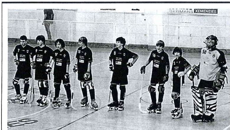
Els alevins del Hoquei Club Castellar, campions de Catalunya

Con el lema Sentmenat Participa, el encuentro está abierto a todo el mundo y servirá también para plantear nuevos proyectos y vías de comunicación entre ciudadanos y administración local ■