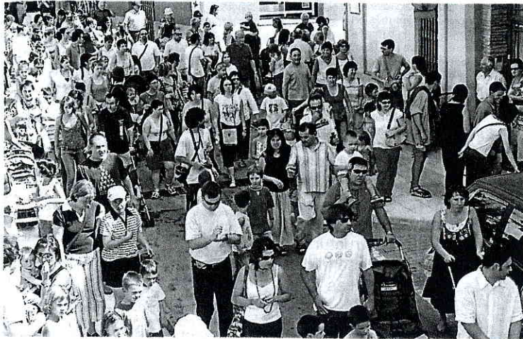
La publicación de Castellar es relativamente joven

Sabadell es la localidad que más hace crecer el número