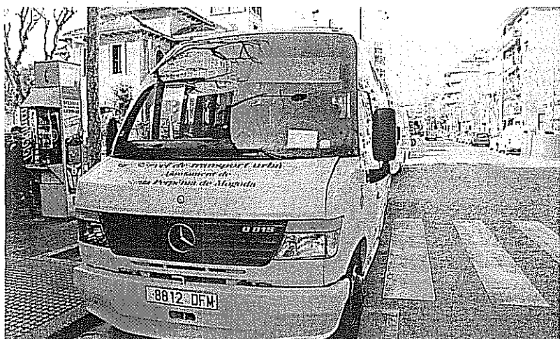
Autobús urbano, que ahora presta un servicio de circunvalación