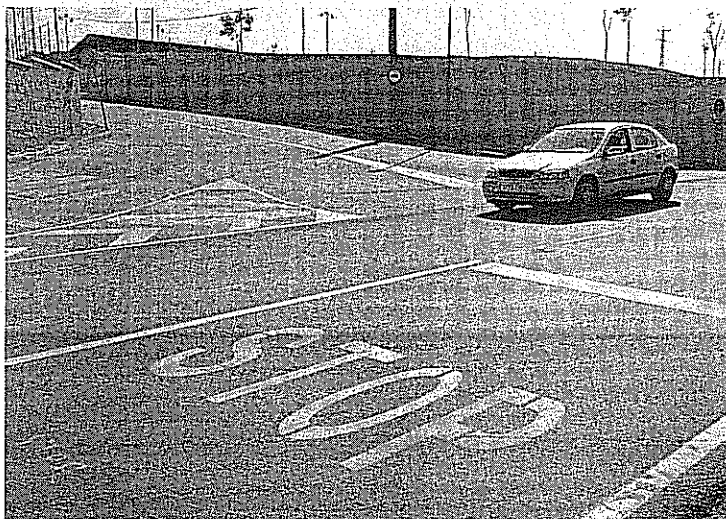
La calle de Isaac Albéniz permite, de forma definitiva, el giro hacia Terrassa. OSCAR ESPINOSA

Esta era una de las grandes preocupaciones de los residentes en la zona, así como de la asociación de vecinos y clase política. La calle de Isaac Albéniz ha sido, históricamente, el acceso a la conocida como "carretera vella de Can Trias", y acceso principal a Terrassa hasta que se completó la prolongación de la C-58. Además, el autobús urbano efectuaba allí el giro para emprender el trayecto hacia término egarenses.