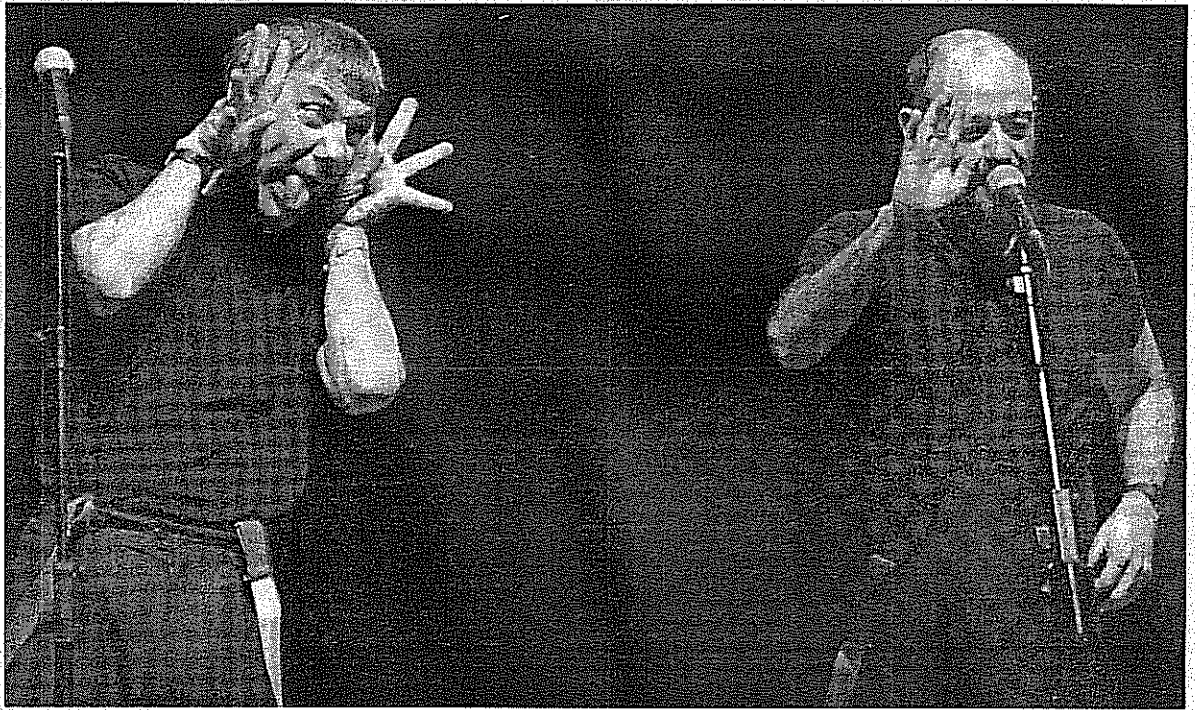
Los humoristas Faemino, expresivo, y Cansado, en un momento de su actuación en el Centre Cultural Caixa Terrassa.