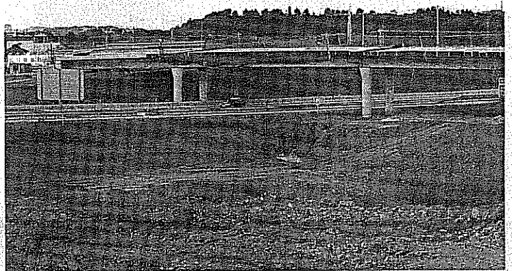
Las obras del IV Cinturó fue el único tema de debate en la asamblea de Can Trias.

El borrador del protocolo que Fomento ha hecho llegar al Ayuntamiento, reduciendo, de 1.641.000 euros a 900 mil la partida destinada a obras en el barrio, motivó el descontento tanto de la entidad vecinal como de todos los partidos políticos.