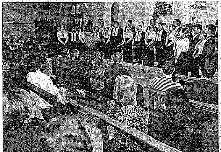
UST Singers demostró por qué es una de las mejores corales del mundo. EDUARDO GIL

La compañía se encuentra de gira por Europa, y una de las paradas fue Matadepera, siendo la primera vez que actúan en el municipio. No así en la comarca, ya que en 2008 ya habían actuado en Sant Quirze del Vallès. La experiencia debió ser satisfactoria, porque repitieron en ese mismo municipio dos días antes de actuar en Matadepera.