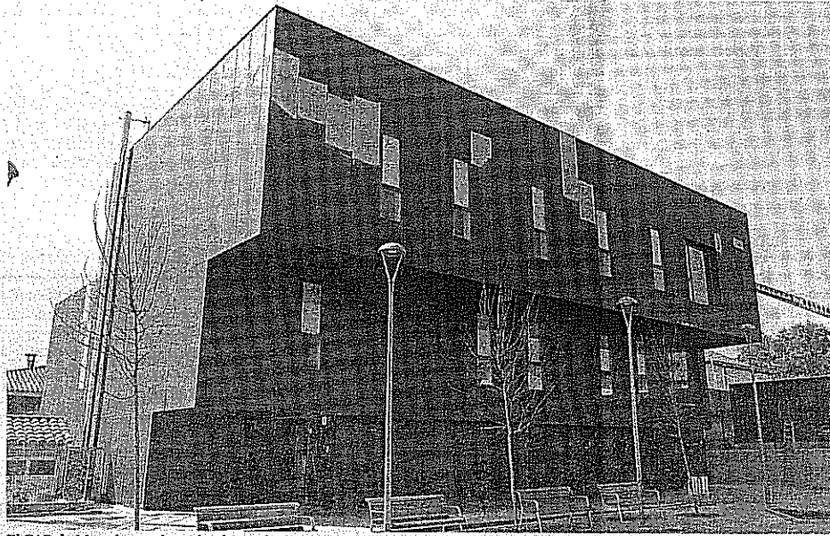
El CAP de Matadepera ha sido objeto de diversas reformas antes de su puesta en funcionamiento.

La noticia se ha hecho pública esta misma semana, y supone un alivio para los usuarios, que llevaban tiempo quejándose por las limitaciones de las instalaciones que han venido utilizando hasta la fecha. Un edificio con espacios y servicios insuficientes en relación a la población con la que cuenta el municipio. Ahora, el nuevo CAP vendrá a suprimir esas carencias, con un edificio nuevo... y remodelado