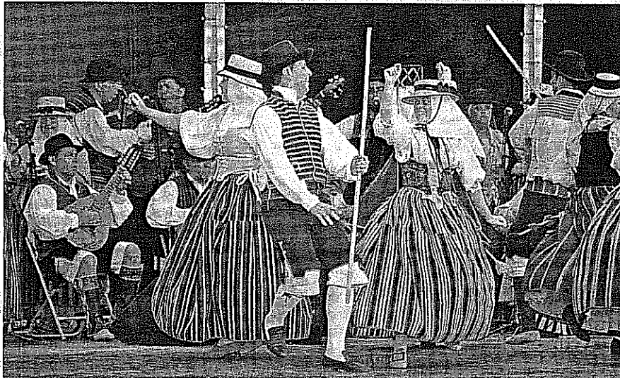
Una de las actuaciones del Rubifolk en el anfiteatro del Parc del Castell.