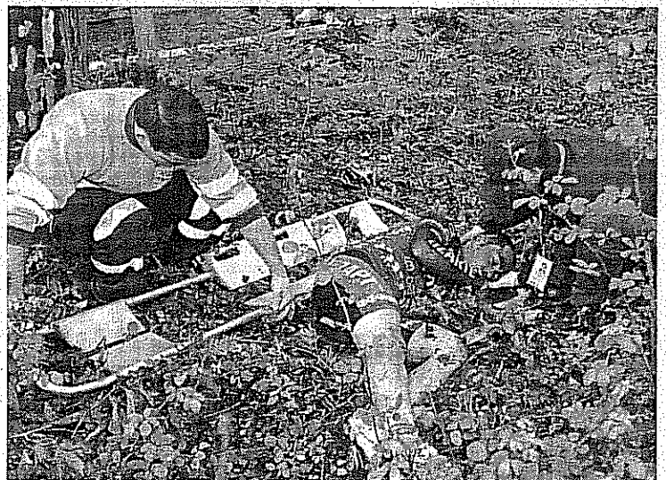
Sergio Thomas, inconsciente, en el momento de ser atendido tras su caída en Cantabria.

huesos del cráneo occipital y peñasco que se produjo el pasado 11 de junio tras caer, bajo una lluvia torrencial, durante el descenso de la collada de Carmona, en el transcurso de la cuarta etapa del Circuito Montañés. Se ha restablecido también de la lesión pectoral con afectación de tres costillas, dos de las cuales se le incrustaron en el pulmón derecho, lo que derivó en un neumotórax. Su lesión en la clavícula derecha evoluciona favorablemente y se espera que esté restablecido de la misma dentro de un mes.