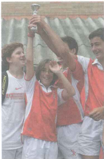
Los distintos equipos locales estarán representados en la competición (CD Terrassa, Egara, Atlètic y

Tomarán parte en este campeonato 900 jugadores y jugadoras pertenecientes a 25 clubs de distinta procedencia. Se jugarán torneos desde la categoría benjamín hasta cadete. La entidad de Les Pedritxes utilizará toda su superficie destinada a la práctica del hockey para dar cabida a un torneo de esta dimensión.