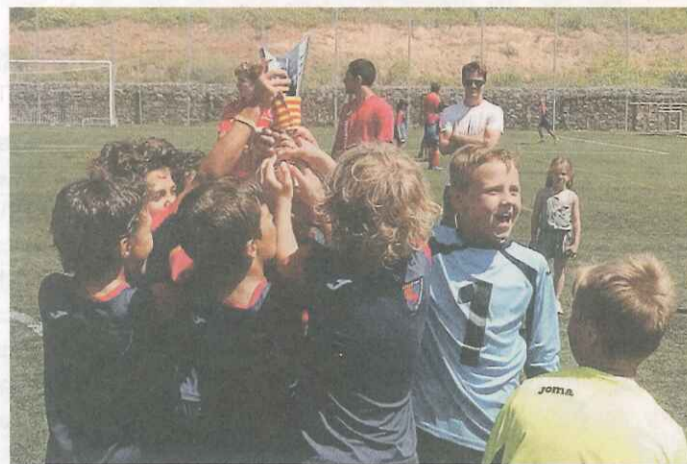
Uno de los equipos ganadores del Matadepera.