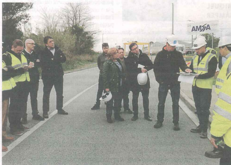
Visita de obras al lugar del incidente, en la mañana de ayer.