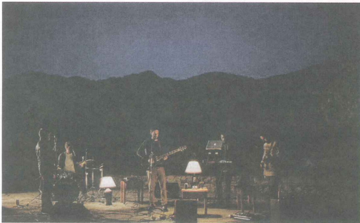
El grupo matadepense Caseta.

Siguiendo este "ambicioso objetivo", la campaña se inició el pasado 10 de marzo, poniéndose como reto el recoger cuatro mil euros en