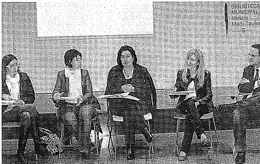
La alcaldesa presentó, ante la oposición rubinense, los datos del plan anticrisis puesto en marcha en 2009.

En lo que concierne a las acciones de gobierno y administración, se ha reducido la carga fiscal de las personas más necesitadas con bonificaciones y subvenciones en tasas y precios públicos, que tendrán continuidad durante todo 2010. Además, se ha aplicado un plan de austeridad con el que se ha conseguido un ahorro neto de 800 mil euros, gracias a un nuevo procedimiento de gestión de recursos humanos.