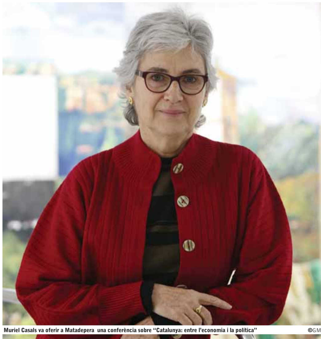
Muriel Casals va oferir a Matadepera una conferència sobre “Catalunya: entre l'economia i la política”

Dones d'Avui de Matadepera (DAMA) organitzen cada mes una conferència i en motiu de la que feia número 100, van convidar a la presidenta d'Òmnium Cultural, Muriel Casals. Sota el lema de “Llengua. Cultura. País”, Òmnium és una de les entitats més importants en la promoció de la llengua i cultura catalanes arreu del territori.