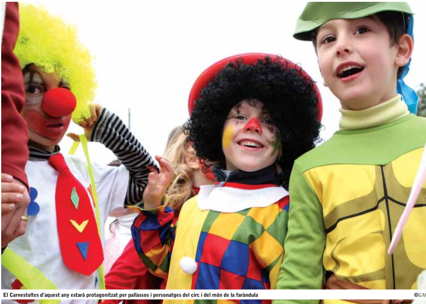
El Carnestoltes d'aquest any estarà protagonitzat per pallasos i personatges del circ i del món de la faràndula

LES FESTES DE SANT SEBASTIÀ TINDRAN LLOC DEL DIVENDRES 14 AL DILLUNS 24 DE GENER