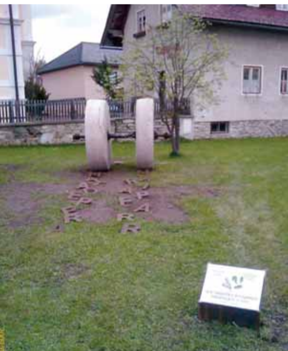
Plaça commemorativa de l'Agermanament, a Mariapfarr

Un altre projecte per a aquest any és la creació d'un arxiu històric de l'Agermanament amb tota mena de material sobre la història d'aquesta amistat: fotos, vídeos, retalls de premsa, fulletons, etc. Des d'aquí volem fer una crida a totes aquelles persones que tinguin material que pugui ser d'interès per a aquest arxiu i que, o bé el vulguin cedir o bé, en cas de fotos i vídeos, ens els vulguin deixar en préstec per fer-ne còpies. Podeu posar-vos en contacte amb nosaltres a través de l'adreça de correu electrònic: agermanament.mm@gmail.com, o bé trucant als telèfons 670801535 o 675681036.