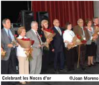
Celebrant les Noces d'or

La Festa de la Gent Gran arriba aquest proper mes d'abril a la seva 21a edició. Tots els empadronats a Matadepera majors de 65 anys poden passar a buscar els tiquets del dinar al Casal de la Gent Gran