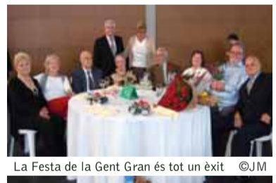
La Festa de la Gent Gran és tot un èxit

Per a totes les persones empadronades a Matadepera més grans de 65 anys, el tiquet del dinar és gratuït i és imprescindible que el recullin, durant la setmana del 14 al 18 de març, al Casal de la Gent Gran. El preu del tiquet dels acompanyants o de persones de fora de Matadepera és de 15'20€. Fora d'aquestes dates no es lliuraran tiquets. També cal recordar que els matrimonis que celebrin les Noces d'Or i que vulguin rebre l'homenatge, han de fer-ho saber el més aviat possible al Casal de la Gent Gran, al telèfon 93 787 17 69, en horari de dilluns a dijous de 9 a 13h i de 15h a 18h, i els divendres només de 9 a 13h.