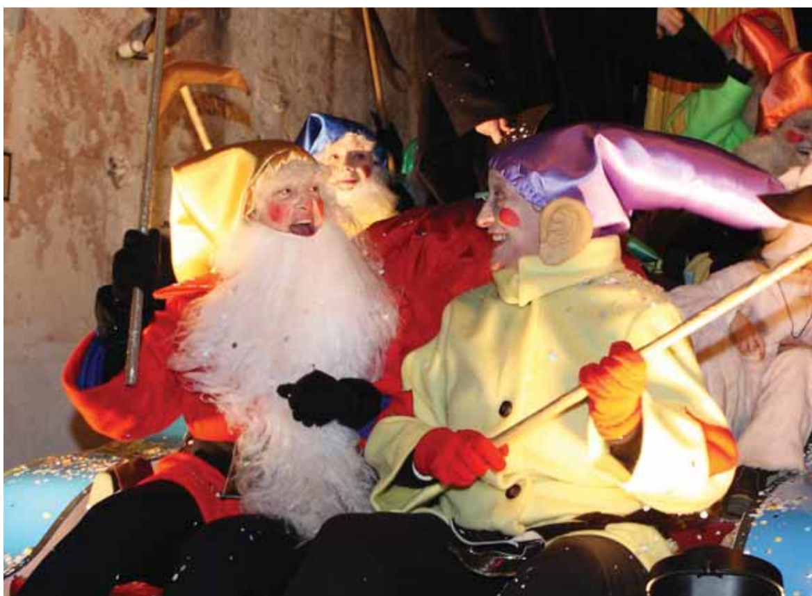
Alguns dels personatges de contes que van protagonitzar la Gran Rua de Carnestoltes de l'any passat

Per tal de celebrar la festivitat més primitiva i transgressora de tot el calendari, la Germandat de la Serpentina ha organitzat un extens programa d'activitats, que començaran el divendres, 4 de març, amb les rues escolars i una obra de teatre dels Amics del Teatre, i s'allargaran fins el dimecres de cendra (9 de març) amb el vetllatori del Rei Carnestoltes i l'enterrament de la sardina. El diumenge 6 de març tindrà lloc la Gran Rua de Carnestoltes.