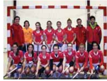
L'equip de sala femení del CDT

El CD Terrassa Hockey Club s'ha proclamat Campió de Catalunya de la categoria 1a Femení d'Hoquei Sala. La final va disputar-se el cap de setmana del 5 i 6 de febrer i les noies de Les Pedritxes van al guanyar al Club Egara per 5 a 2.