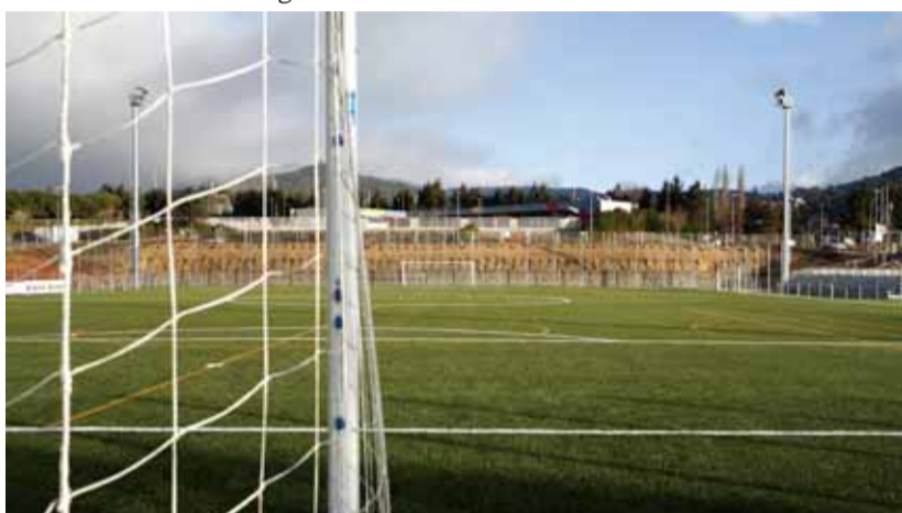
Si les obres segueixen el calendari previst, a principis de març el camp podria començar a funcionar

Els treballs per a finalitzar l'obra van començar el divendres 11 de febrer i tindran un cost de 17.000 €, que es distribueixen en les següents feines