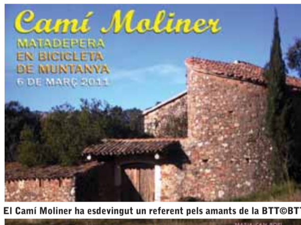
El Camí Moliner ha esdevingut un referent pels amants de la BTT

El proper 6 de març tindrà lloc la 13ª edició del Camí Moliner en BTT. La ja tradicional pedalada en BTT començarà a les 8:30 hores del matí, des del Pavelló Multifuncional. Com ja és habitual, hi haurà dos recorreguts, degudament senyalitzats: la ruta curta consistirà en 28 km i, la llarga, en 50 km aproximadament. A part d'aquestes dues opcions de recorreguts, també hi haurà la ruta familiar guiada. Al llarg dels recorreguts, els participants podran parar a esmorzar a La Barata i, més endavant, trobaran dos avituallaments amb menjar i beure per recuperar forces. A l'acabar, hi haurà botifarres, pica-pica i molts regals per a tots els participants. Per a més informació, podeu visitar la pàgina web: www.btt.esport.com