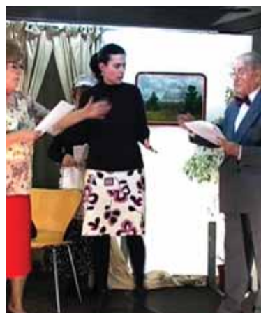
Actuació del Grup de Teatre

través de les oficines de Benestar Social (Carretera de Terrassa, núm. 35), al telèfon 93 787 17 69, o bé, a través del 6 99 51 30 39. Els assajos s'acostumen a fer al Casal de la Gent Gran mateix.