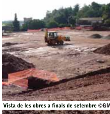
Vista de les obres a finals de setembre

Pel que fa el tema de la gespa artificial, el passat dijous dia 16 de setembre, es varen obrir les pliques per adjudicar el subministrament i instal·lació de la gespa. Es van presentar 6 ofertes i, també a principis d'octubre, es farà l'adjudicació, de