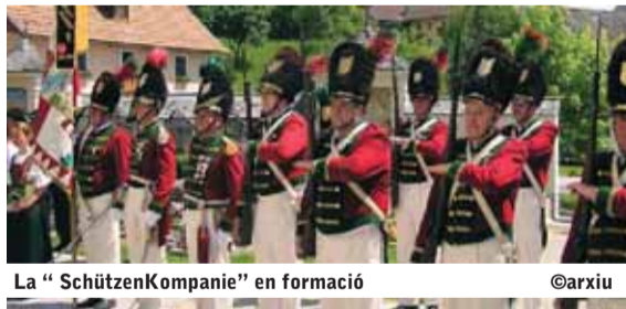
La "Schützenkompanie" en formació

promoció de l'ús de l'Spa Samsunn per la canalla i les famílies. Ens ha agradat especialment un interessant article sobre les pedres de molí i el seu ús, en motiu del regal de les dues pedres de molí que Matadepera els va fer pel 25è aniversari de l'Agermanament.