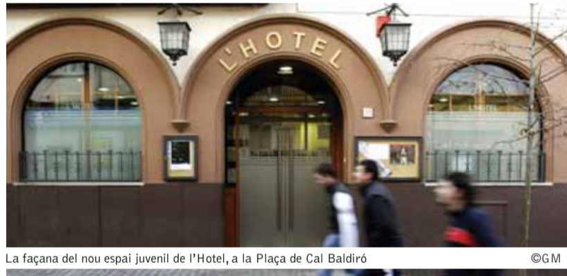
La façana del nou espai juvenil de l'Hotel, a la Plaça de Cal Baldiró