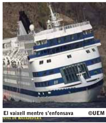
El vaixell mentre s'enfonsava