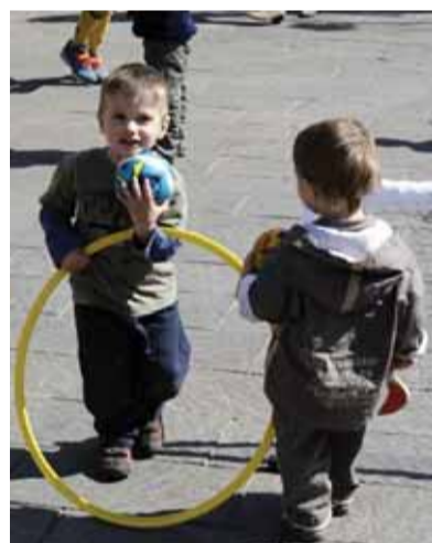
Dos nens jugant a la plaça de Cal Baldiró

En el marc de xerrades organitzades per l'Ajuntament i la comissió d'escola de pares dels centres públics de Matadepera, es durà a terme la primera xerrada d'aquest curs escolar adreçada a tota la comunitat educativa. La xerrada sobre "El temps lliure dels nostres fills i filles: si és lliure, quins criteris poden ser educatius. El temps setmanal, els caps de setmana, les vacances", vol oferir un espai de diàleg per parlar sobre com, des de casa, els pares fomenten l'organització del temps dels fills i si, com a adults, calen més estratègies per aconseguir que gestionin millor el seu temps lliure.