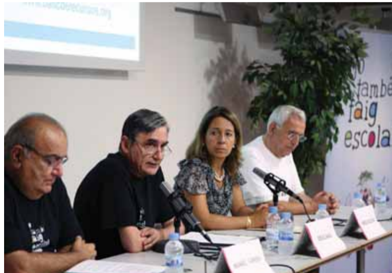
La campanya es va presentar a la Sala d'Actes del Casal de Cultura

Banc de Recursos és una ONG que ha celebrat aquest 2010 el 15è aniversari. En aquest temps, el seu objectiu ha estat la redistribució dels recursos existents de manera més justa, recollint excedents materials d'empreses i particulars, i enviant-los a països i col·lectius desfavorits (Tercer i Quart Món), creant i enfortint les xarxes de cooperació nord/sud i fomentant la solidaritat entre les pròpies entitats del nord.