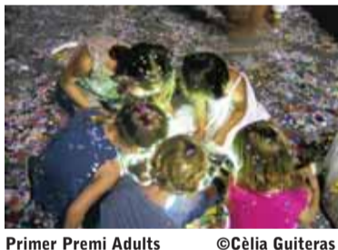
Primer Premi Adults