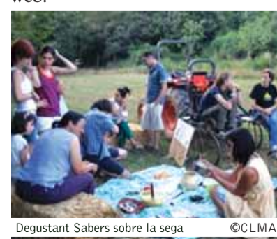
Degustant Sabers sobre la sega

El CLMA també vol convidar a tothom qui hi estigui interessat a participar de les juntes que celebra el consell el primer dimecres de cada mes. Podeu posar-vos en contacte amb l'entitat al mateix web.