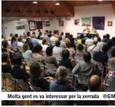
Molta gent es va interessar per la xerrada

El reportatge d'aquest mes recull algunes de les principals reflexions que va fer l'economista sobre les causes que ens han portat a una situació de crisi profunda com l'actual.