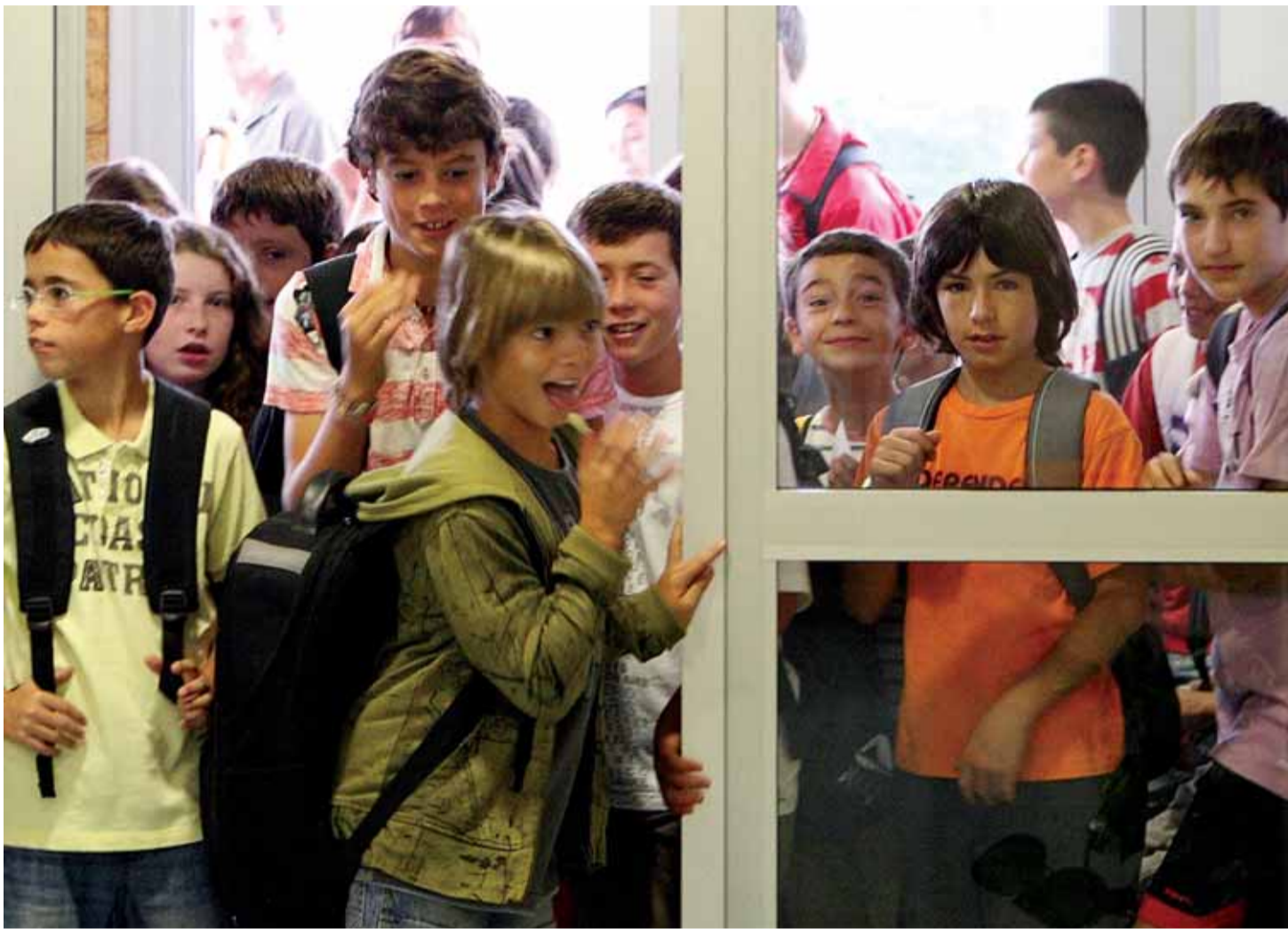
Alguns dels alumnes de l'Escola Joan Torredemer, davant la porta d'entrada, volien ser els primers a entrar a la classe

AQUEST ÉS UN ANY DE CANVIS, PEL PROJECTE EDUCAT I PEL QUE FA AL CALENDARI ESCOLAR