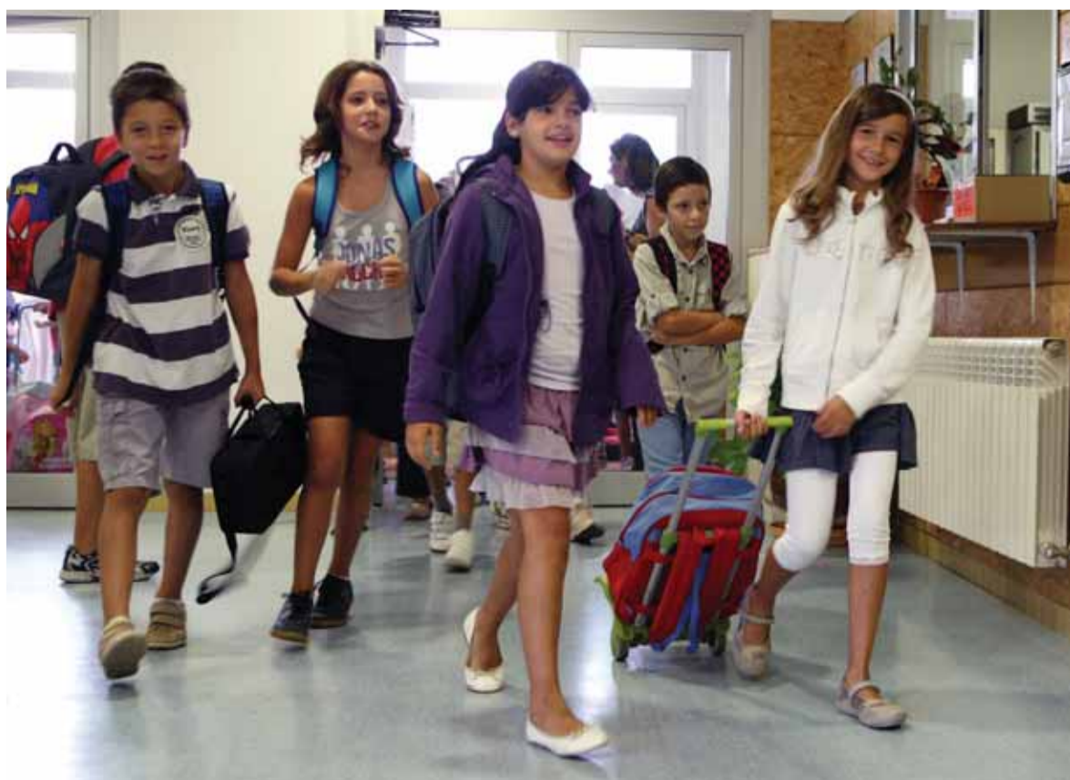
Amb el nou calendari escolar, impulsat pel Departament d'Educació, l'inici del curs 2010-2011 va tenir lloc el 7 de setembre