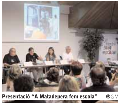
Presentació "A Matadepera fem escola"

Amb la campanya "A Matadepera fem escola", la ONG Banc de Recursos pretén recollir fons per a construir un centre de noves tecnologies a Santa Cruz de la Sierra (Bolívia).