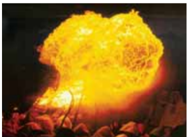
Primer Premi Joves