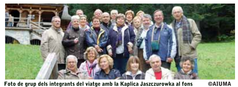
Foto de grup dels integrants del viatge amb la Kaplica Jaszczurowka als fons

visita a diversos llocs de la capital. El dilluns, viatge a Wroc?av, amb parada a Czetochowa, per veure la Moreneta polonesa. El dimarts, Wroc?av. El dimecres, corprenedora visita als camps d'Auschwitz i Birkenau, on tants éssers humans van ser exterminats, i arribada a Cracòvia. El dijous, visita al gueto (amb dues sinagogues i un cementiri jueu); a la tarda, les immenses mines de sal. El divendres al matí, va acabar la visita a Cracòvia, veient l'església de Santa Maria i el turó de Wawel i la universitat on estudiaren Copèrnic i, anys més tard, el futur Joan Pau II; havent dinat viatge a Zakopane, amb parada a Binarowa. Dissabte, recorregut per aquesta turística població als peus dels Cárpat, rematada amb un abundant sopar muntanyenc i música popular en viu. El diumenge, retorn a Matadepera.