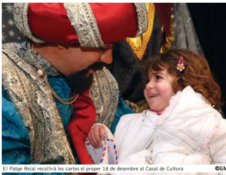
El Patge Reial recollirà les cartes el proper 18 de desembre al Casal de Cultura

El 5 de desembre, com és tradicional, hi haurà la Cavalcada dels Reis