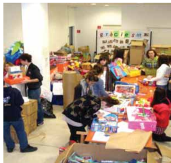
Els alumnes de l'Institut col·laboren amb Creu Roja

L'últim dia que es poden portar les joguines als punts de recollida esmentats és el 15 de desembre . Fora d'aquest termini es poden portar a Creu Roja directament.