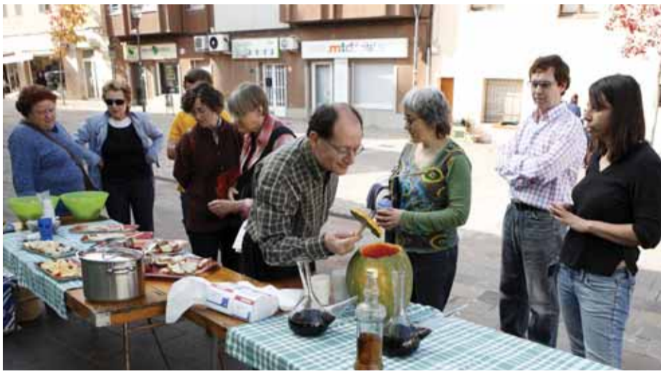
Els visitants van poder tastar alguns productes elaborats amb varietats agrícoles locals

L'exposició del Consell Local de Medi Ambient, "Recollim Sabers", va ser el tret de sortida d'un projecte de divulgació i conservació de les varietats agrícoles del municipi de Matadepera i les rodalies. El projecte consisteix en identificar, conèixer i revitalitzar el cultiu de les varietats per assegurar-ne la seva conservació.