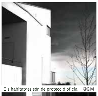
Els habitatges són de protecció oficial

Per a qualsevol dubte, els sol·licitants es poden adreçar al telèfon 93 730 17 77, o bé, enviar un correu a la següent adreça electrònica: ramirezml@matadepera.cat