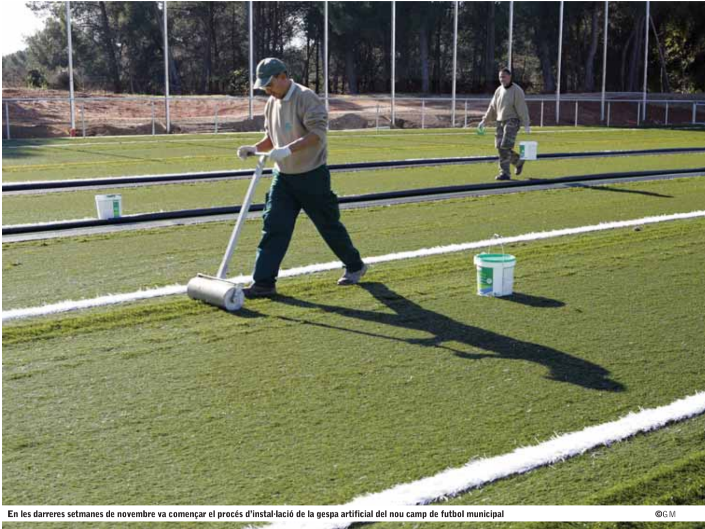
En les darreres setmanes de novembre va començar el procés d'instal·lació de la gespa artificial del nou camp de futbol municipal

LA INAUGURACIÓ DEL CAMP DE FUTBOL ESTÀ PREVISTA PER A MITJANS DE GENER