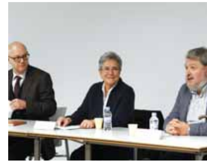
Duran va presentar el llibre a Matadepera @GM

El Consell Local de Medi Ambient va dedicar el mes de novembre a fer un recull dels sabers tradicionals, així com a promocionar les varietats agrícoles del nostre territori