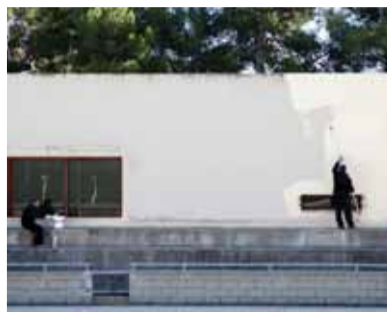
Treballs de pintura a les piscines

El principal objectiu d'aquesta iniciativa era facilitar una oportunitat de treball a persones que es troben en situació d'atur i afavorir la posterior inserció laboral. Aquestes persones han tingut un contracte laboral de caràcter temporal, amb