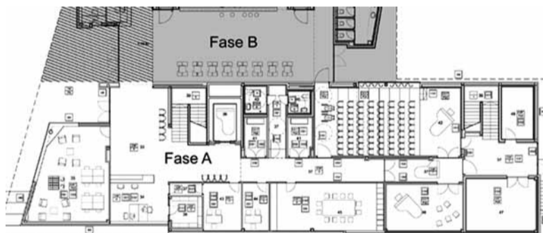
Plànol de l'edifici on s'ubicarà la nova Escola de Música (fase A del projecte) ©Ajuntament

Aquest nou equipament cultural, ubicat en un dels accessos principals al municipi, ocuparà un lloc preeminent com a escenari d'espectacles musicals i teatrals que actualment es fan en espais que resulten poc adequats per aquest tipus d'activitats. El nou espai polivalent permetrà programar tota mena de representacions escèniques i musicals i espectacles de petit i mitjà format, que responguin a la nombrosa demanda de les diferents entitats relacionades amb les arts escèniques i musicals del municipi.