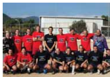
Foto d'equip del Matadeperenc

El diumenge 14 de novembre es va celebrar, a Les Pedritxes, la 4ª edició del Campionat de Tennis Adaptat. Van participar jugadors procedents de l'escola de disminuïts psíquics de Barcelona, que dirigeix Sergi Bruguera, juntament amb els jugadors procedents de Fupar i Prodis que durant l'any entrenen amb els tècnics del CDTerrassa.