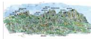
Planell del recorregut de les ermites

El nou curs de l'Agrupació Coral ha començat amb molta activitat: -El 14 de novembre passat, l'Agrupació Coral de Matadepera va col·laborar amb una cantada en el dinar solidari celebrat a la Masia la Tartana, organitzat per l'ONG Banc de Recursos. - El divendres, 19 de novembre, es va celebrar un concert de música barroca a l'Auditori del Conservatori de Música de Terrassa, dins el cicle que organitza l'Ajuntament de Terrassa. La Coral, juntament amb la Coral Nova Ègara i l'Orquestra Centenari, va interpretar obres de H. Purcell Vivaldi i Handel sota la direcció de Joan Martínez Colás. - Seguint la tradició, el diumenge 21 de novembre, l'ACM va participar a la Missa de 12 de la Parròquia de Sant Joan per commemorar la festivitat de Santa Cecília, patrona de la música. Per aquest mes de desembre, la Coral ha programat dos concerts de Nadal: el dijous dia 16, a les 9 del vespre, a l'Església de Sant Pere de Terrassa; i el concert de Nadal a Matadepera, que aquest any serà el dia de Sant Esteve a les 21:20 hores, a l'Església. Us hi esperem!