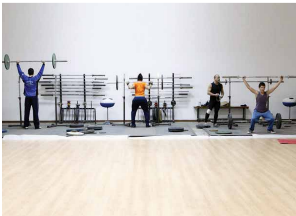
El projecte de reforma de la sala d'halterofília ha comportat millores en els vestidor i la instal·lació de parquet