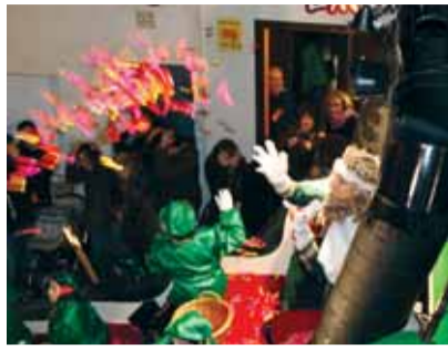
La Cavalcada començarà a la Pl. Sant Jordi@GM

A finals de novembre van començar els moviments per a la construcció de la primera fase del Teatre Auditori, que és el projecte de l'Escola de Música.