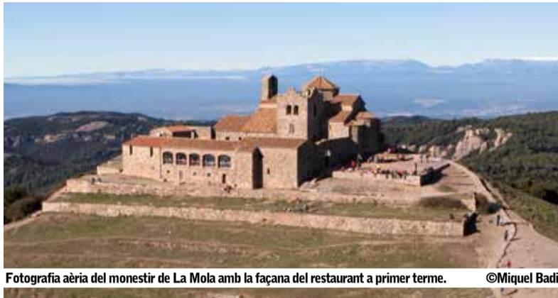
Fotografia aèria del monestir de La Mola amb la façana del restaurant a primer terme.