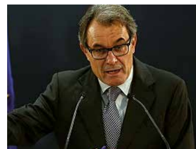
Artur Mas en un acte del PDECAT.

L'agrupació local del PDECAT Matadepera organitza, per al proper dilluns 30 de gener, una conferència que portarà per títol: "Preparant el nou país". L'acte anirà a càrrec del Molt Honorable Sr. Artur Mas, president del Partit