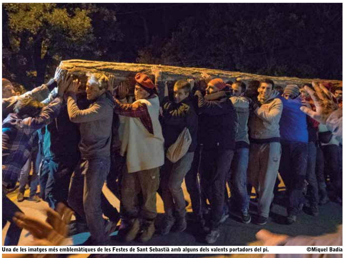
Una de les imatges més emblemàtiques de les Festes de Sant Sebastià amb alguns dels valents portadors del pi.

Mostra Gastronòmica "Els Tastets", que aquest any celebra el 40è aniversari; la plantada del pi a mà a la plaça i el Gran Concurs de Grimpaires. A banda de les convocatòries més concorregudes, al llarg dels quasi quinze dies que s'allarguen les festes, hi haurà nombrosos actes dedicats a rememorar el nostre passat i les persones que ens han llegat l'herència d'aquestes tradicions tan nostrades. A algunes d'aquestes persones, que van treballar per recuperar les festes, se'ls farà un sentit homenatge.