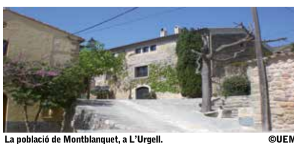
La població de Montblanquet, a L'Urgell.

La tercera és l'etapa més llarga d'aquesta ruta, que commemora el 30è aniversari de la UEM. L'inici tindrà lloc a l'aparcament del Monestir de Poblet (a la Conca de Barberà) i es travessarà la població per fora. A l'Espluga de Francolí es passarà per davant de les Coves de l'Espluga i del Cellar Modernista o Museu del Vi. I després