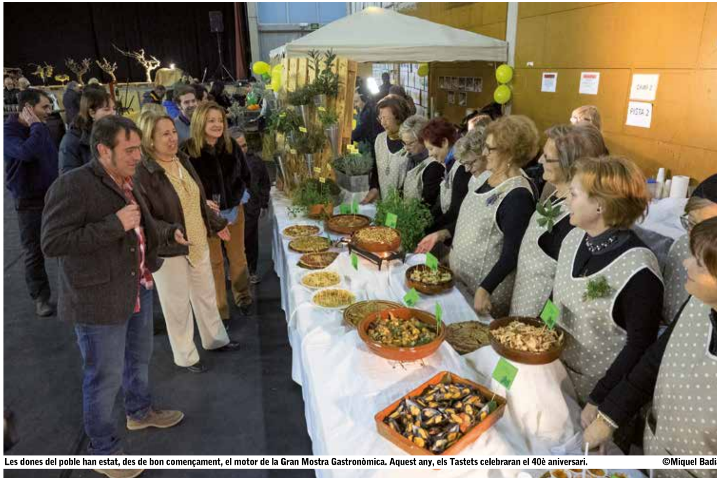
Les dones del poble han estat, des de bon començament, el motor de la Gran Mostra Gastronòmica. Aquest any, els Tastets celebraran el 40è aniversari.

LA GRAN MOSTRA GASTRONÒMICA OBRIRÀ LES PORTES EL 15 DE GENER A LES 18 HORES