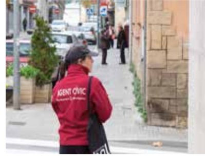
L'agent cívica a peu de carrer.

La principal funció de les agents cíviques de l'Ajuntament és detectar els actes d'incivisme i alertar, per tal d'intentar posar-hi remei. La llista de reincidents s'envia a la Policia Local.