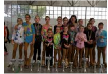
Les medallistes després de la competició.

La sisena jornada de campions de handbol va enfrontar el 18 de desembre passat al pavelló els dos primers classificats: el Handbol Veterans Matadepera i el Handbol Gavà Veterans. El partit, que va ser molt disputat, va acabar amb un resultat de 22 a 26, a favor del Gavà. Amb aquest resultat, el Handbol Gavà Veterans es col·loca líder de la classificació i el Handbol Veterans Matadepera baixa a la tercera posició.