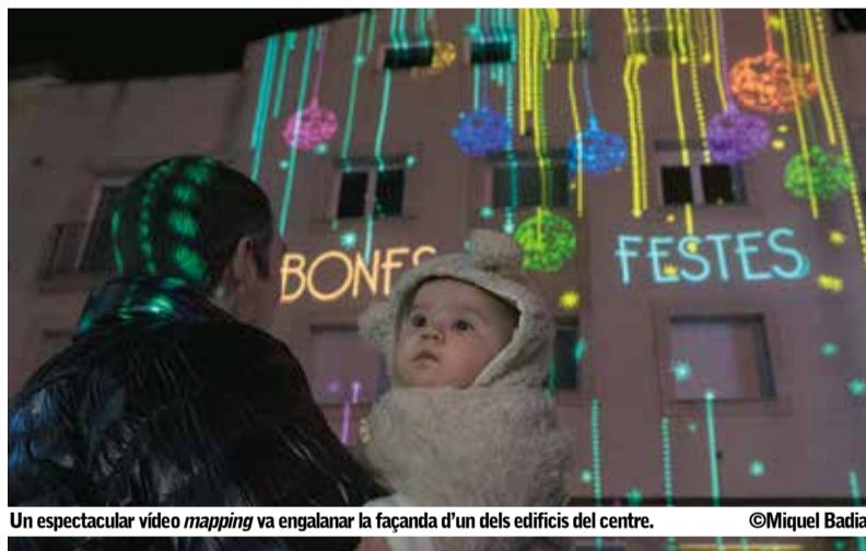
Un espectacular video mapping va engalanar la façana d’un dels edificis del centre.

Aquest any, les regidories de festes i comerç han apostat per un nou espectacle visual, consistent en un vídeo mapping, és a dir, la projecció d’imatges i objectes virtuals sobre la façana d’edificis.