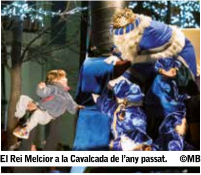
El Rei Melcior a la Cavalcada de l'any passat.