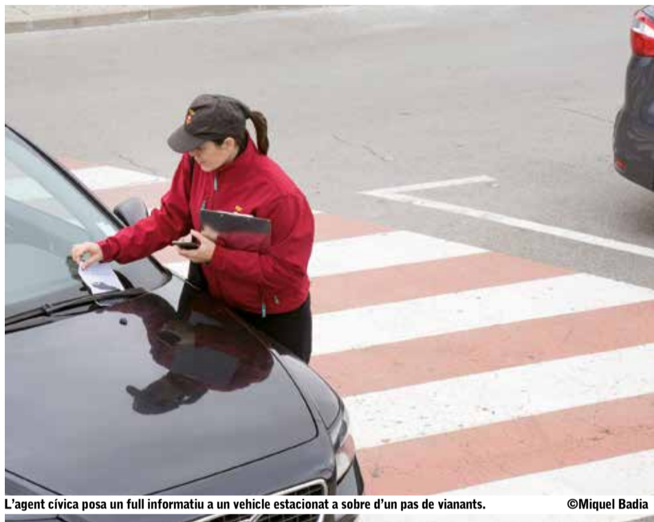
L'agent cívica posa un full informatiu a un vehicle estacionat a sobre d'un pas de vianants.

Cada dia, dues agents cíviques vetllen al carrer i des de l'Ajuntament per detectar vehicles mal estacionats, mobiliari urbà trencat, excrements de gossos i escombraries fora d'hores. Els avisos es tramiten amb la Brigada i la Policia Local que solucionen el problema i sancionen l'infractor.