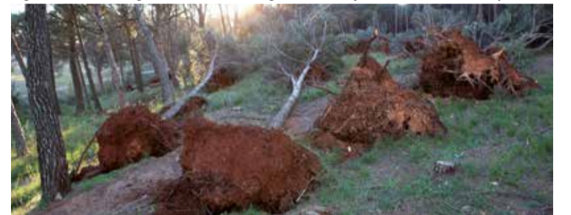
Alguns dels arbres caiguts al Bosc de les Farigoles fa dos anys.

que va provocar el vent al poble. Tanmateix, gràcies al treball de tots els matadeperecs es va restablir la normalitat. "Estem al dia", ha con-