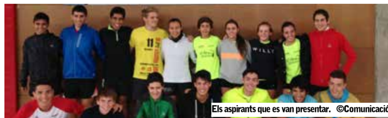
Els aspirants que es van presentar.

Matadepera i Ripoll van ser les dues poblacions escollides per a dur a terme les proves d'accés al CTCMC.