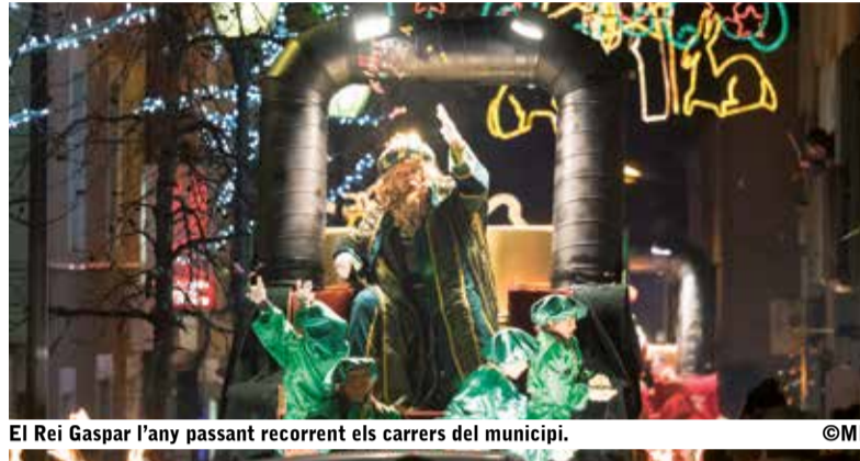
El Rei Gaspar l'any passant recorrent els carrers del municipi.

el seu recorregut passarà per la plaça Sant Jordi, carrer Sant Llorenç, Sant Isidre, plaça de Cal Baldiró, carretera de Terrassa, carrer Joan Paloma i plaça de l’Ajuntament. Aleshores, els Reis d’Orient seran rebuts per les autoritats i sortiran al balcó del consistori per saludar a tots els matadeperecs presents a la plaça. La cavalcada seguirà llavors pels carrers Montserrat, i Sant Joan, on faran una parada davant de l’església per dirigir-se a peu fins a la plaça del casal per fer la tradicional ofrena al pessebre vivent que organitzen els Amics del Teatre de Matadepera. En aquest moment, es reprendrà la cavalcada pels carrers Sant Joan, Sant Llorenç i plaça Sant Jordi, per finalitzar al pavelló. Com és tradició, Melcior, Gaspar i Baltasar lliuraran una joguina als nens i nenes menors