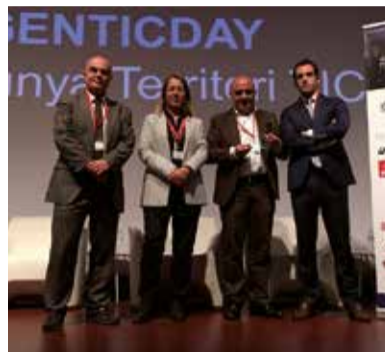
El moment de recollir el premi.

una cita obligada per a empresaris que estiguin en ple procés de transformació digital de les seves empreses, així com per a professionals del