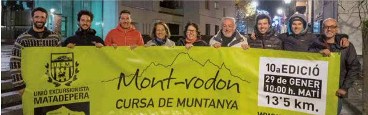
Els organitzadors de la Cursa del Mont-rodon, amb l'Alcaldessa i el Regidors d'Esports, amb la lona que anuncia la carrera.

Amb 12,5 km i 600 metres de desnivell, la desena edició d'aquesta exigent cursa de muntanya es presenta com una cita ineludible de la temporada pels trail runners.