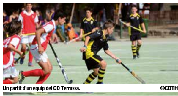
Un partit d'un equip del CD Terrassa.

La Fundació Catalana per l'Esport ha lliurat al club el premi en categoria "Esport Català al món" per haver contribuït a millorar la imatge de l'esport català a nivell internacional.